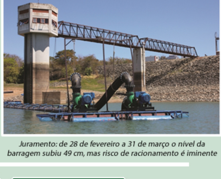
Juramento: de 28 de fevereiro a 31 de março o nível da barragem subiu 49 cm, mas risco de racionamento é iminente

Até o dia 05/04/17, os municípios do Norte de Minas em situação de emergência reconhecida pela Sedec por causa da seca já eram 36: Janaúba, São João do Paraíso, Matias Cardoso, Jaíba, Chapada Gaúcha, Juramento, Cachoeira de Pajeú, Itacambira, Várzea da Palma, Pedras de Maria da Cruz, Verdelandia, Ibiracatu, Pai Pedro, Coração de Jesus, São Romão, Varzelândia, Grão-Mogol, São Francisco, Gameleiras, Botumirim, Lontra, Novorizonte, Mamonas, Januária, Mato Verde, São João da Ponte, Luislândia, Josenópolis, Uruçuia, Ponto Chique, Ubaí, Manga, Bocaiuva, Japonvar, Indaiabira e Serranópolis de Minas.